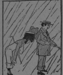
—ANITA—En realidad, Pepe, este es un país muy lluvioso y las calles que tenemos su idea me parece excelente. Con un permiso voy a esdoblar las enaguas yo también.