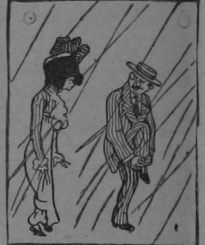
—PEPE—Vaya un chaparrón. Bien dicen las enciclopedias que Costa Rica es el país donde más llueve. Con un permiso voy a esdoblar los pantalones para defenderlos del barro.

Para la estación lluviosa tiene AHULADOS en todo tamaño CA-PAS, PANCHOS y PARAGUAS HERRERO HERMANOS