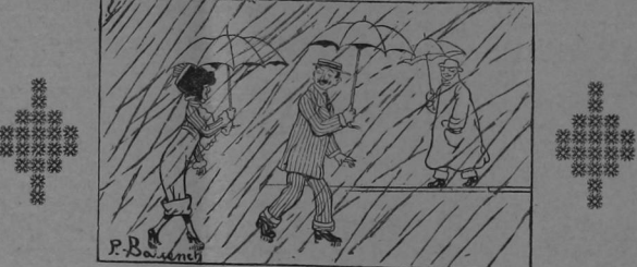
Y luego hay quienes aseguran que las faldas cortadas no son prácticas!

Los anunciadores de La Información y personales tienen derecho de exigimos pruebas de que el tiraje diario del periódico es de 6.000 ejemplares